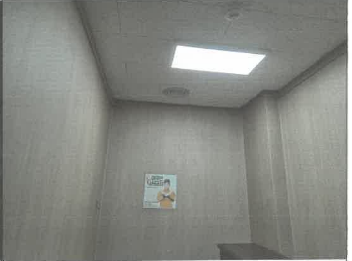
3층 피아노실 천장 몰딩 수리