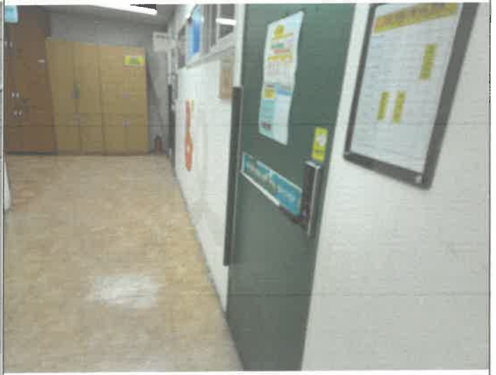
프로그램실 출입문 도어 손 끼임 방지 물딩 설치