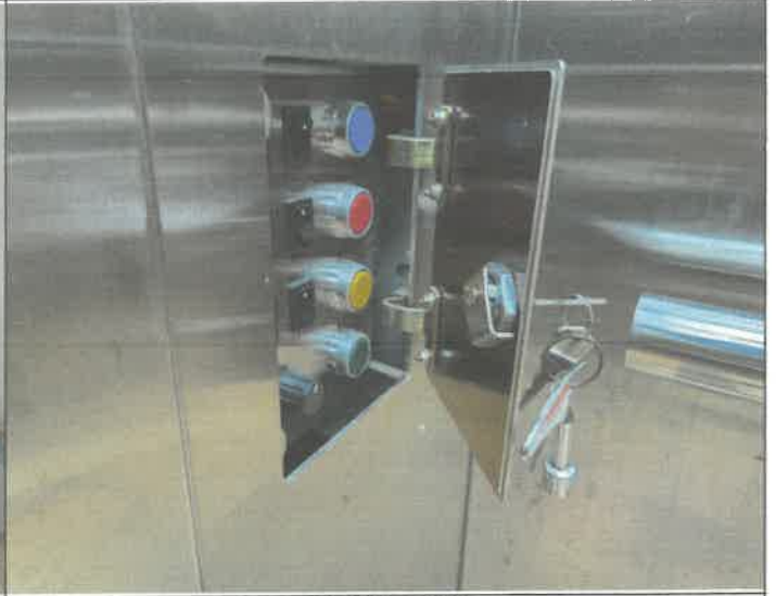
승강기 제어반 키박스 수리