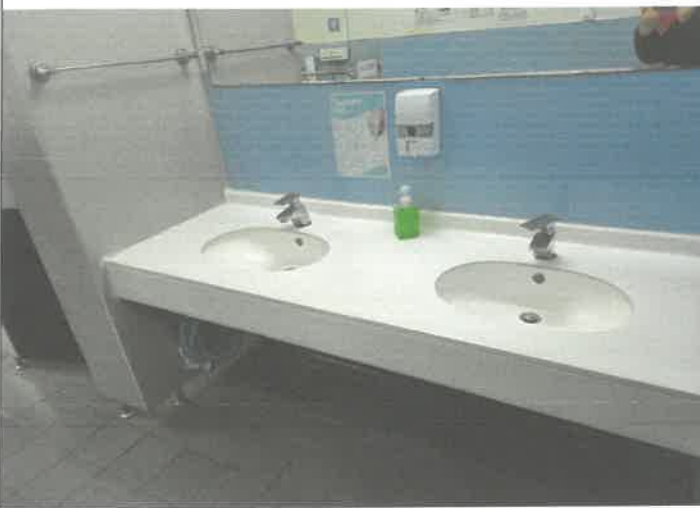
3층 남자 화장실 세면대 수전 누수 조치