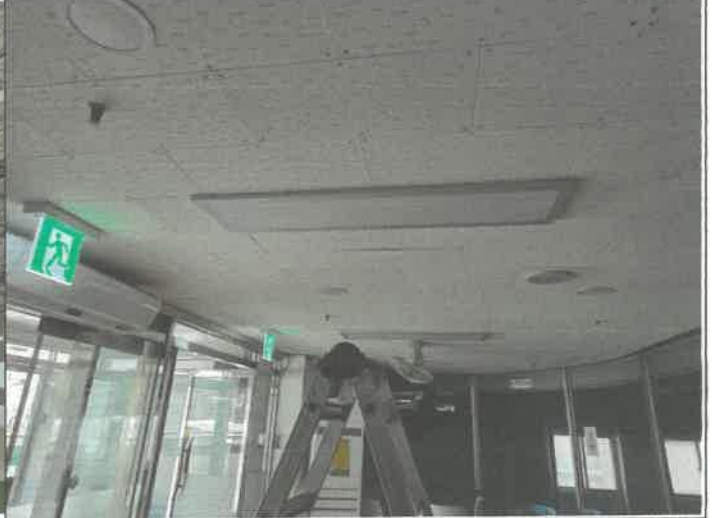
수영장 로비 천장 매립등 1개소 점등 불량 교체