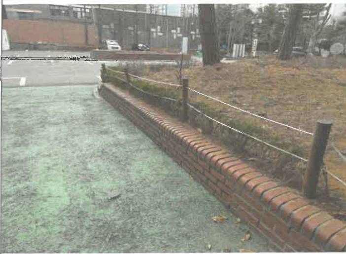
주차장 출입구 쪽 화단 울타리 로프 교체