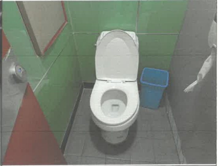
2층 여자 화장실 변기 막힘 통수