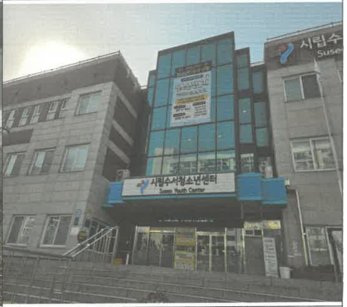
청소년 전용제 현수막 설치