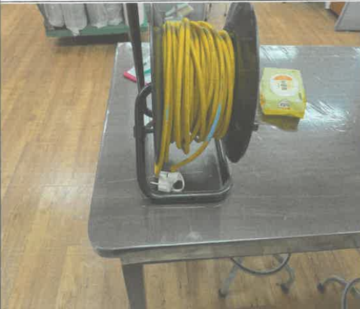
리드선 플러그 교체