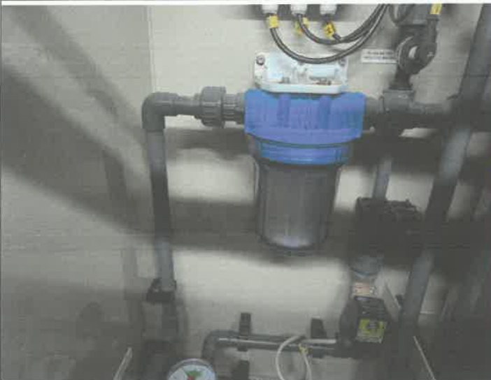
염소 발생기 물 필터 교체