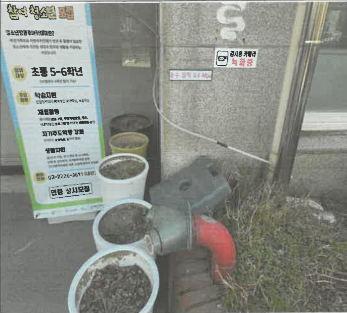
옥외 소화전 송수 압력 표시 게시