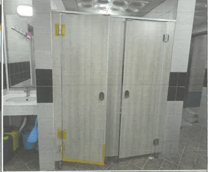
수영장 남자 샤워실 내부 화장실 1개소 문짝 경첩 전면 교체