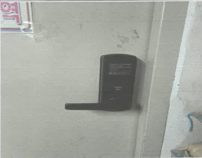
기계실 수영장 쪽 출입문 도어락 파손 수리