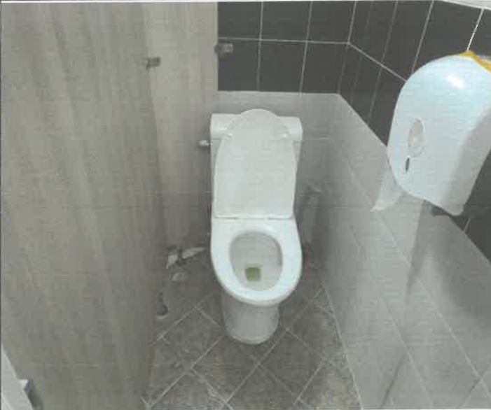
수영장 남자 샤워장 내 화장실 변기 커버 고정 볼트 파손 1개소 교체