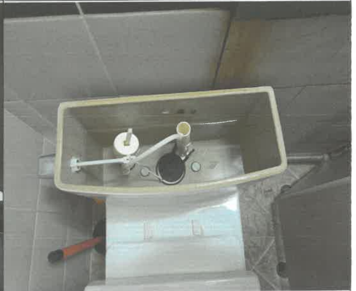
수영장 남자 샤워실 내부 변기 수위 조절