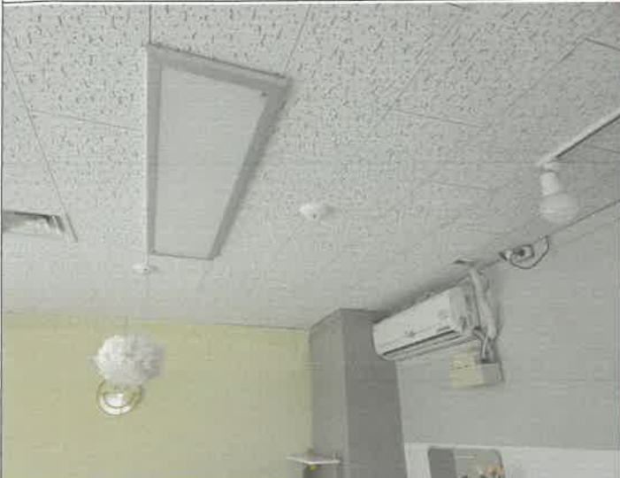
프로그램실 정온식 화재 감지기 ~ 차동식 화재 감지기 교체