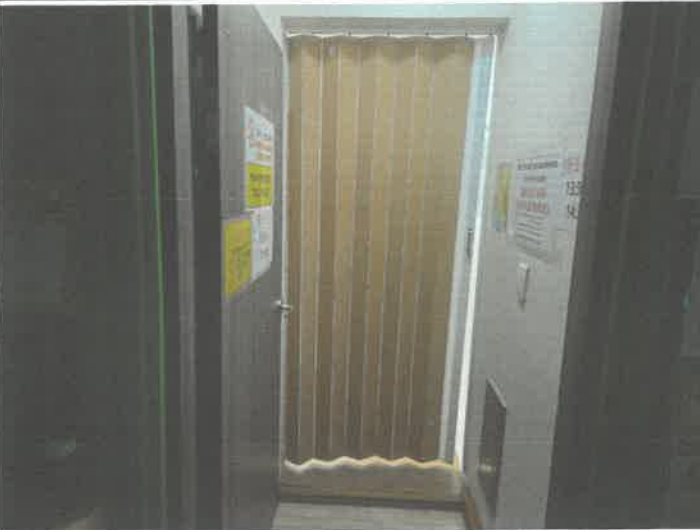
대체육관 남자 탈의실 출입 아코디언도어 교정 수리