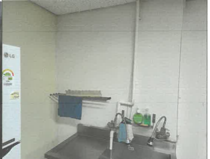
제과 제빵실 벽 페인트칠