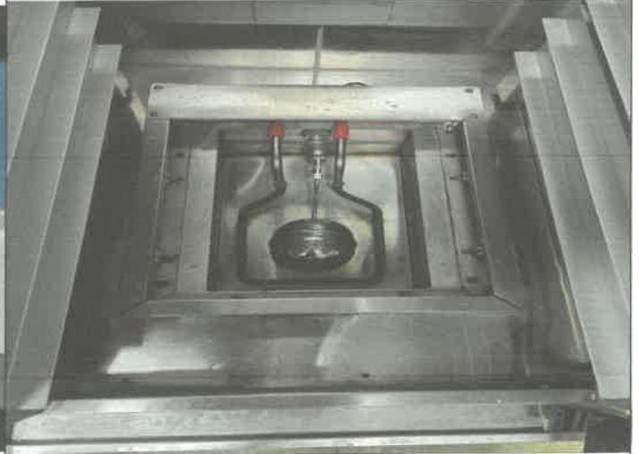
지하 1층 제과 제빵실 발효기 내부 물탱크 수위 조절용 볼탑 교체