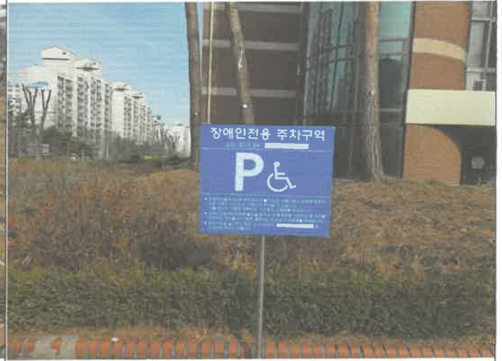
장애인 전용 주차 구역 표지판 교체