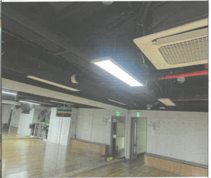
지하 소 체육관 전등 1개소 재결선