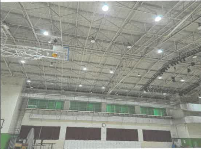
체육관 천장 전등 고리 이탈 복구